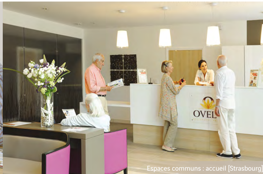
Espaces communs : accueil [Strasbourg]

Chiffres clés de la résidence services senior