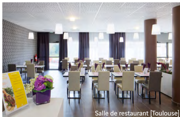
Salle de restaurant [Toulouse]