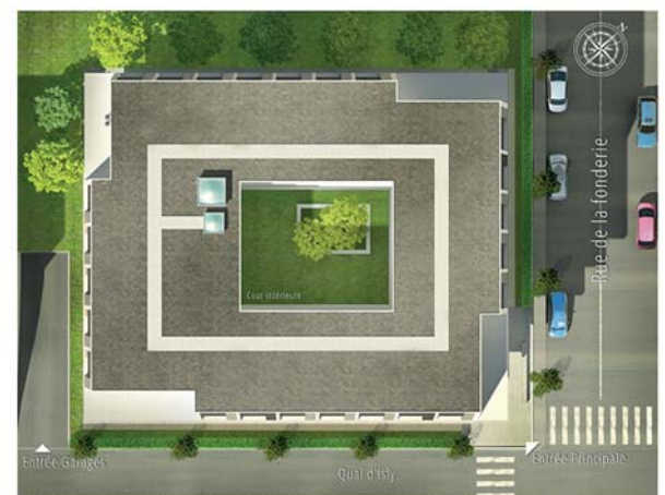
Plan de masse de la résidence