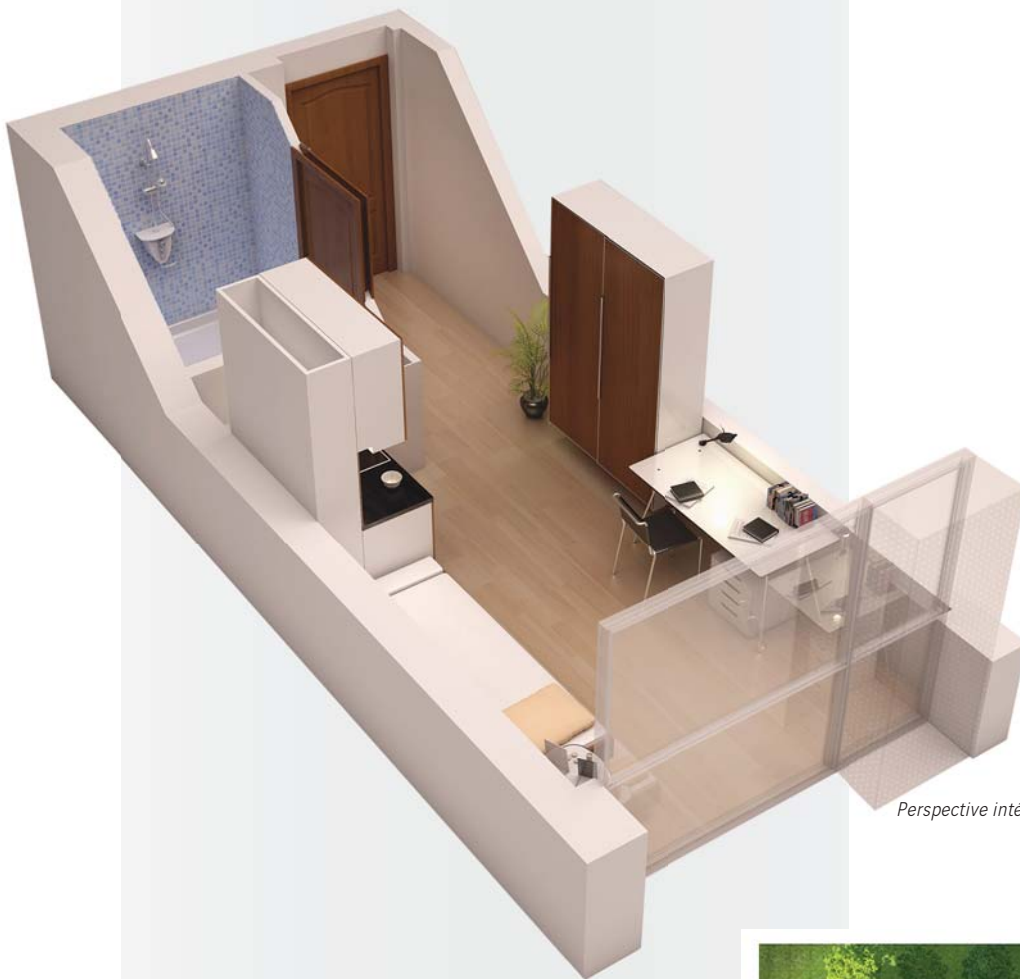
Perspective intérieure 3D