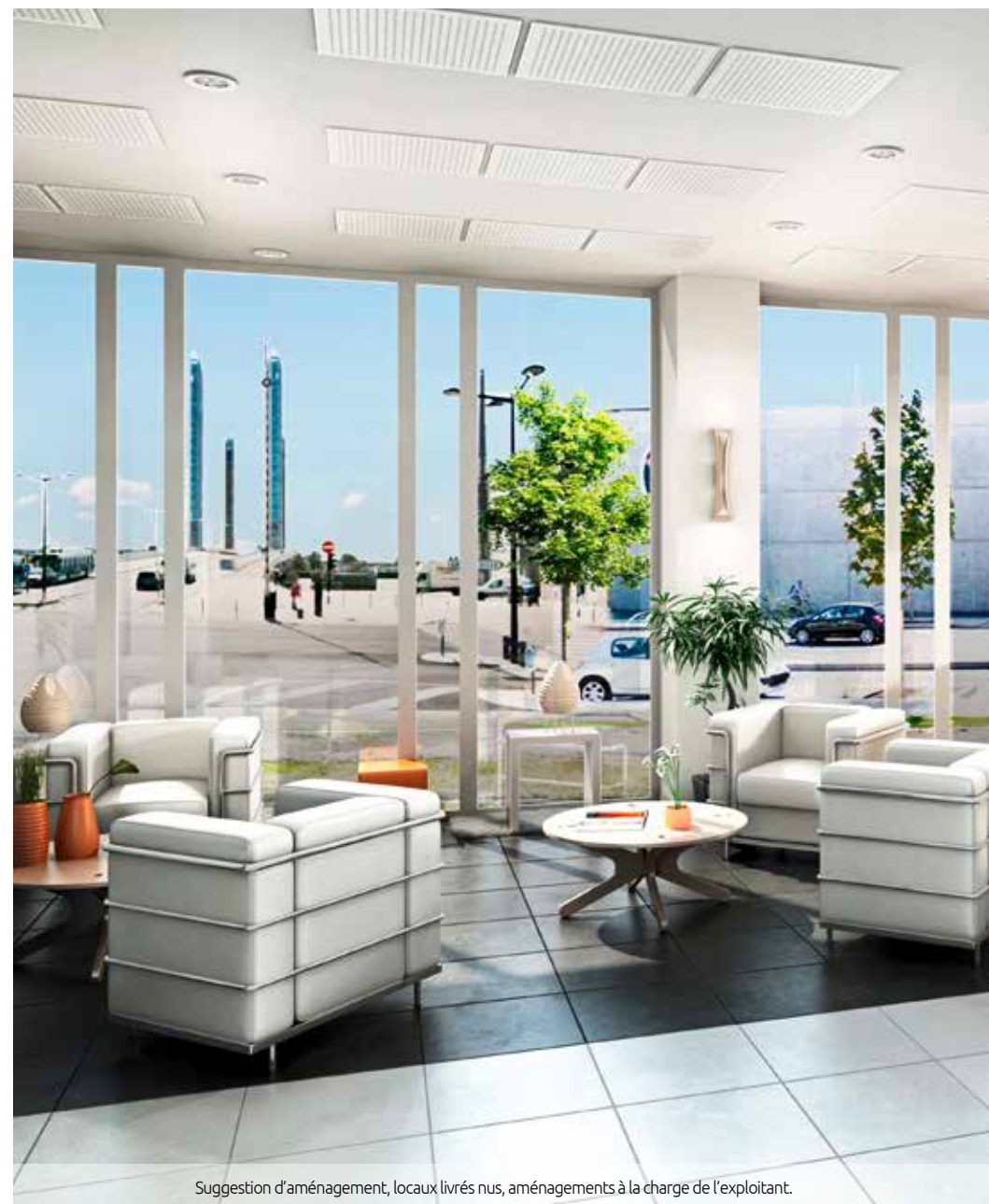
Suggestion d'aménagement, locaux livrés nus, aménagements à la charge de l'exploitant.