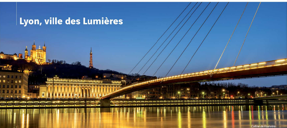
Colline de Fourvière