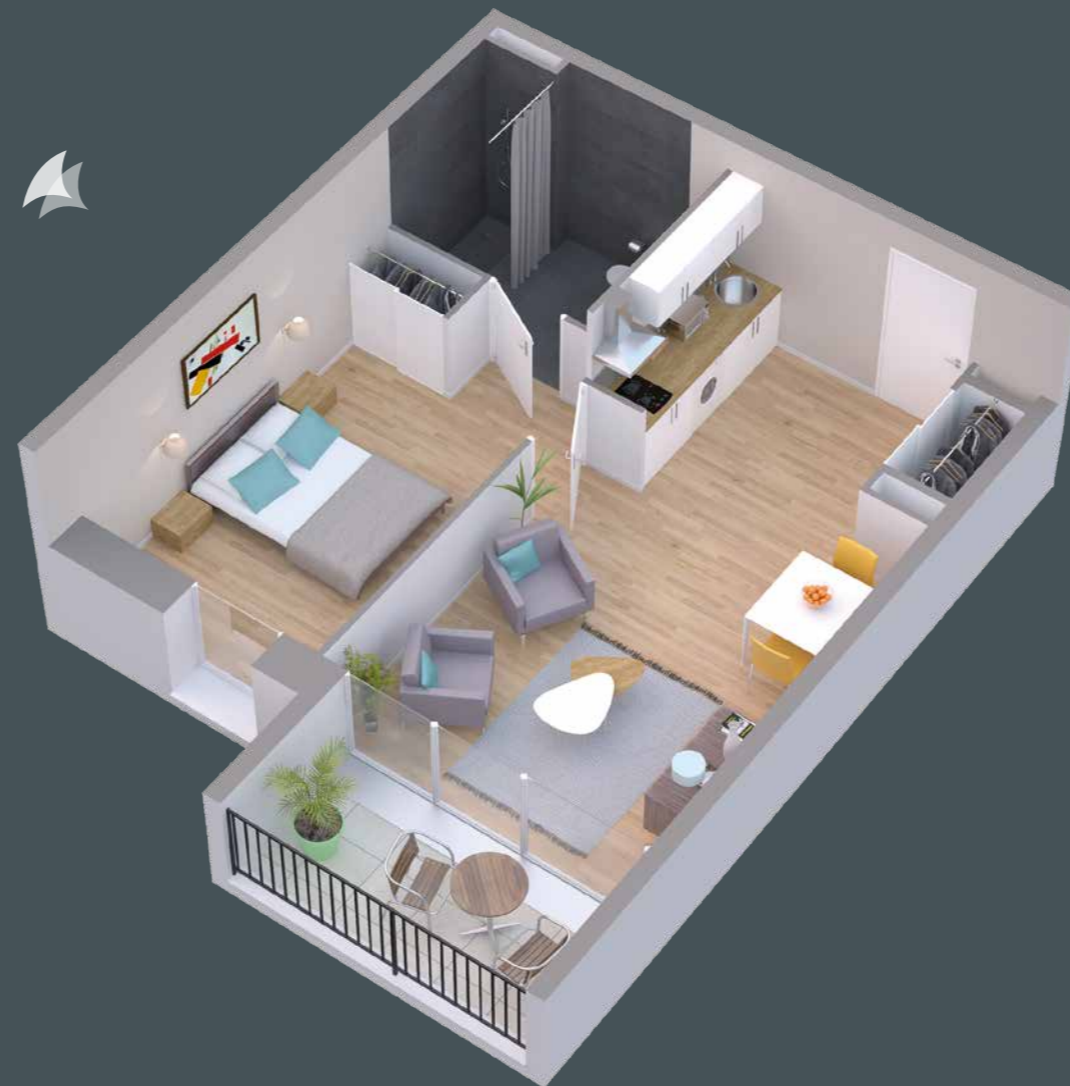
Exemple d'appartement studio